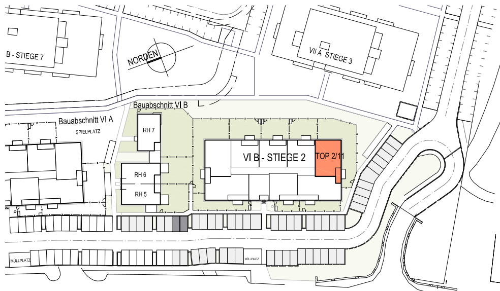
LAGESITUATION KEIN MAßSTAB