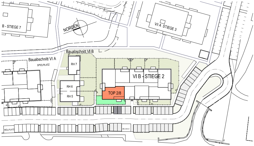
LAGESITUATION KEIN MAßSTAB