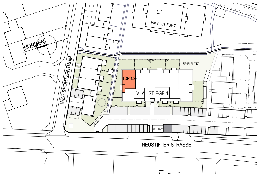
LAGESITUATION KEIN MABSTAB