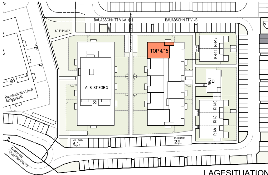
LAGESITUATION KEIN MAßSTAB