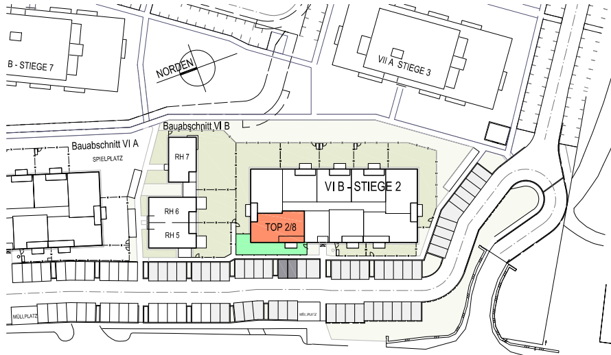
LAGESITUATION KEIN MAßSTAB