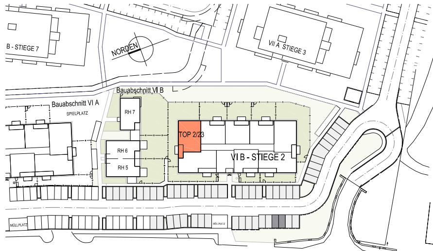
LAGESITUATION KEIN MAßSTAB